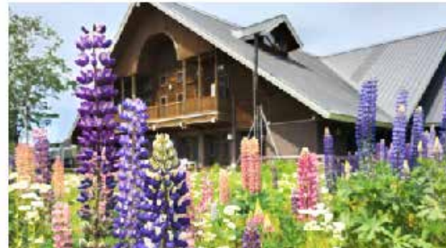
北欧の杜公園のルピナス