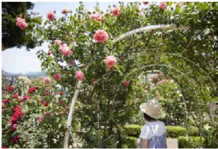
石田ローズガーデン

初夏の奥秋田エリアでは、様々な花畑や花にちなんだイベントが行われます。優しい香りに癒されるフラワースポットへお出かけしてみてもいいでしょうか。