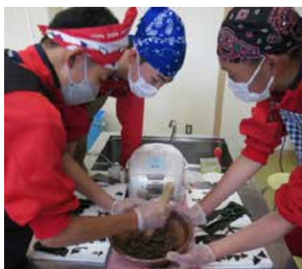
ジビエのしぐれ煮

秋田犬ツーリズムとしては、阿仁学園や関係機関と連携し、地域への誘客に繋がる施策として成功させるため、経済的支援、PR 等含め全面バックアップを行ってまいります！