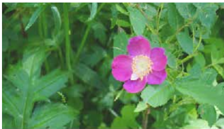
長走風穴高山植物群落