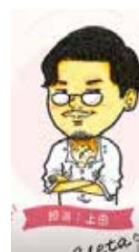
私が担当しました！