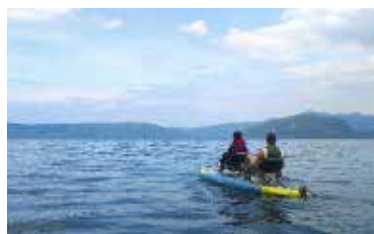
新緑の十和田湖へ

旅行系 YouTube チャンネル「スーツ旅行 / Suit Travel」(チャンネル登録者数 120 万人) を招へいし、動画の撮影・制作および情報発信を実施しました。