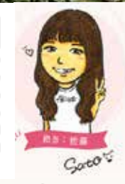
私が担当しました！