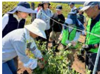
スナップエンドウ収穫