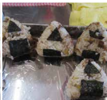
のりでAを表しています！