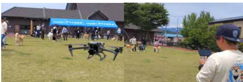
真剣にドローン操作中！