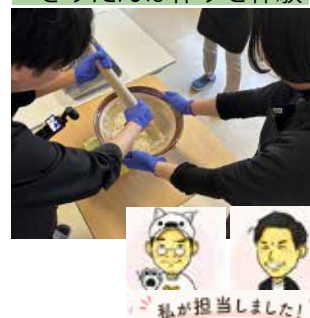
きりたんぼ作りを体験

撮影・取材は5月25日(月)から27日(水)までの3日間にわたって行われました。前回の発信で取り上げなかったスポットを中心に取材先を選定し、日景温泉を拠点に十和田湖の水上アクティビティ「HOBIE」で新緑の景色を楽しむ旅程を提案したほか、「ベニヤマきりたんぼ工房」でのきりたんぼづくり体験や、「秋田比内や」での比内地鶏料理など、大館ならではの食や体験も紹介する内容となっています。制作された YouTube 動画は、7月中に公開される予定です。