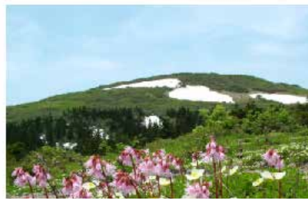
森吉山の高山植物【花の百名山】