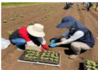
えごまの苗を植えています

畑での作業を終えた後は、えごまの基礎知識や健康効果について学び、えごま茶、えごまいなり、採れたてのスナップエンドウを試食。えごまの魅力を「育てる・学ぶ・味わう」の三つの視点から体験していました。